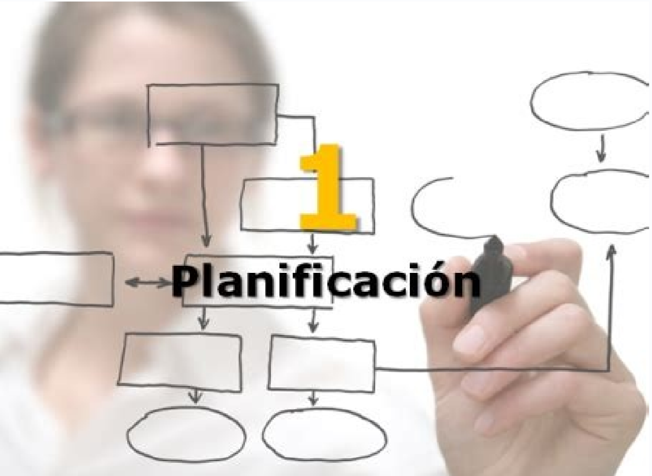
Características principales de la planeación educativa. Cuales son las características de la planeación educativa. Características de la planeación educativa en Mexico. Características de la planeación educativa pdf. Características de la planeación estratégica educativa.